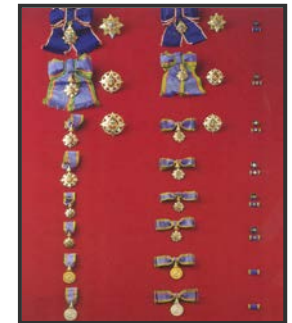
เครื่องราชอิสริยาภรณ์ อันมีเกียรติยศยิ่งมงกุฎไทย

กลุ่มงานทะเบียนประวัติและบำเหน็จความชอบ กองบริหารทรัพยากรบุคคล ชั้น ๕ อาคาร ๕ กรมสนับสนุนบริการสุขภาพ โทร. ๐ ๒๕๙๐ ๑๖๔๐, ๐ ๒๕๙๐ ๒๘๐๘ โทรสาร ๐ ๒๕๙๐ ๑๖๔๐