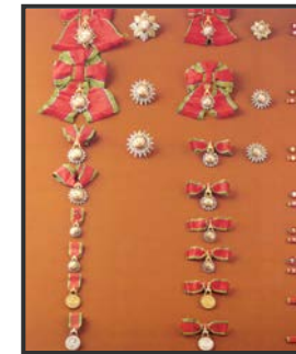
เครื่องราชอิสริยาภรณ์ อันเป็นที่เชิดชูยิ่งข้างเผือก